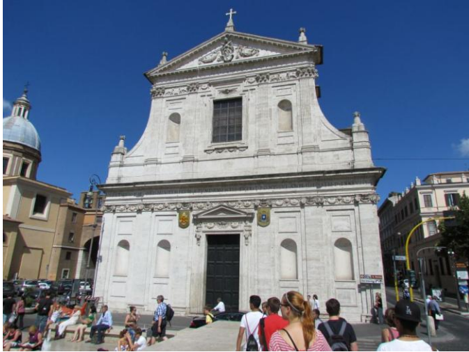
Ara Pacis von außen