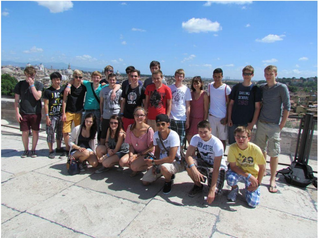
Unser Klassenfoto auf der Engelsburg.

Bericht von Felix Zhu