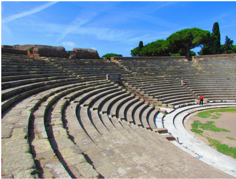
Amphitheater der Ostia Antica

Am Nachmittag ging es dann zu den Caracalla Thermen und zu einem kurzem Abstecher zum Circus Maximus.