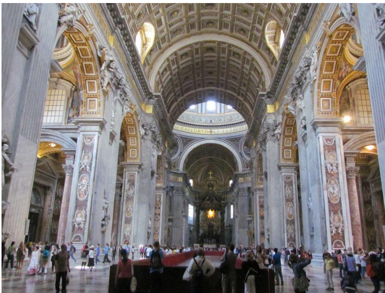
Petersdom von innen

Die Engelsburg selbst sollte Illuminati-Fans ein Begriff sein. Obwohl der Ausblick nicht mit dem des Petersdoms mithalten kann, bietet dieser einen schönen Überblick über Rom.