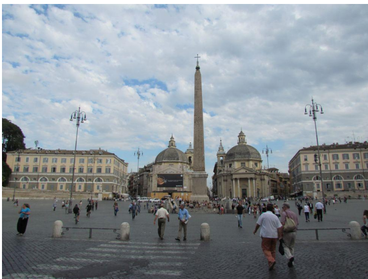
Piazza de Popolo

Im "Camping Roma" angekommen wurde in den Chalets schnell ausgepackt und kurz eingekauft. Für manche war schon hier der erste Halt beim McDonalds angesagt. Jedoch hatten wir ein straffes Programm durchzustehen, sodass wir uns noch am selben Tag mit den öffentlichen Verkehrsmitteln Roms zur Piazza del Popolo begaben, den eindrucksvollen Trevi-Brunnen besichtigten, zur Spanischen Treppe gingen und das Pantheon kennenlernten. Erschöpft kehrten wir dann abends heim.