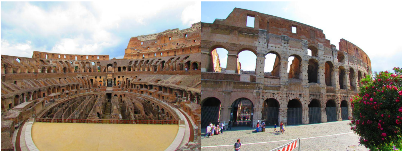
Das Kolosseum von innen und außen

Auch der Swimming-Pool bot aufgrund des wirklich warmen Wetters eine Möglichkeit der Freizeitbetreibung.